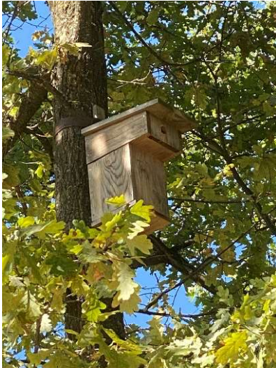
Observation de ce qui nous entoure